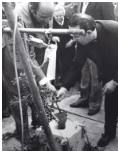
Col·locació de la primera pedra del temple, fa 50 anys

Acabada la celebració de l'Eucaristia i després d'agrair a tanta gent que havien col·laborat en la preparació de la festa, s'oferí un recordatori de la celebració i un petit piscolabis, en un clima de joia pasqual.