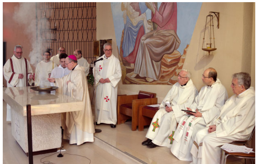
Moment de la dedicació del temple

Sota el lema «Tenir una casa, una taula i un sol cor», diumenge 28 tingué lloc el ritus de la dedicació del temple, amb la presència del bisbe Agustí, i la nombrosa participació dels feligresos i de fidels de les altres parròquies del poble. També hi participà una representació de la confraria del